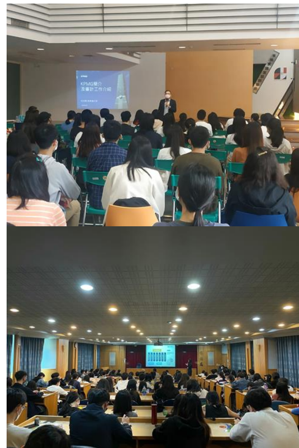
企業說明會示意圖