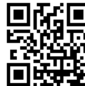
東吳人就業實習平台